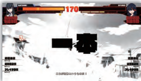
様々な攻撃を行い対戦相手の体力ゲージを0にすると 1本 。