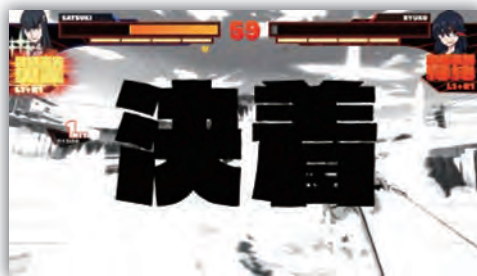
2本先取したプレイヤーの勝利となります。